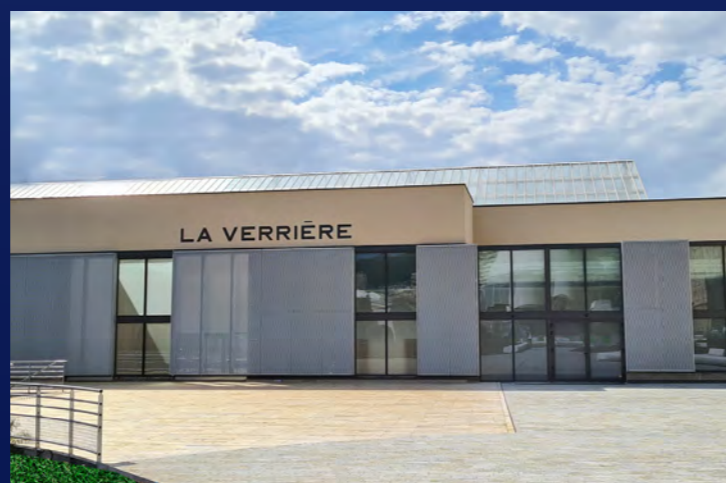
L'ESPACE FAURIEL VERRIÈRE - CENTRE DE CONGRÈS